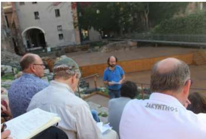
Een filosofische bezinning in het antieke theater: voordrachten over retoriek, relativisme en epistemologie

In Catania begon het programma met een verkennende wandeling langs muren, bolwerken, barokke kerken en kloosters en een bezoek aan het antieke Romeinse theater. Het Romeinse theater is geheel geïntegreerd in de huidige bebouwing. De verschillende bouwlagen zijn goed zichtbaar en illustreren hoe door de eeuwen heen bouwwerken werden hergebruikt.