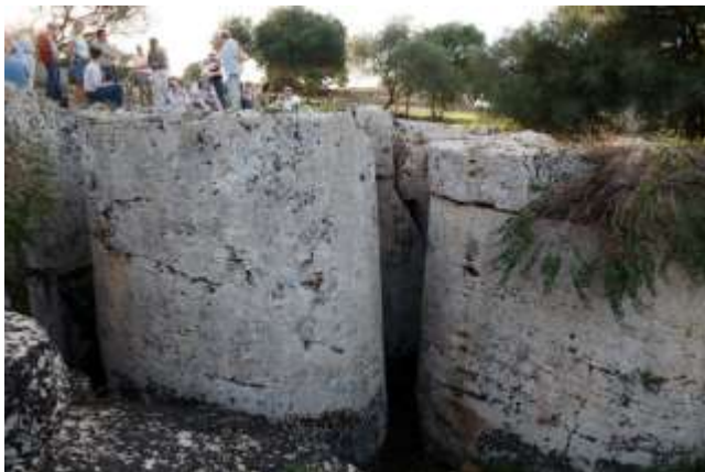
De indrukwekkende afmetingen van de steenblokken die bestemd waren voor tempel G in Selinunte, die niet meer kon worden afgebouwd

De plaats werd in 409 v. Chr. hals over kop verlaten toen een Carthaagse vloot Selinunte bedreigde.