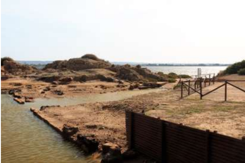
De Kothon: lange tijd werd dit waterbassin beschouwd als een haven, maar het zou bv. ook als wateropslag gediend kunnen hebben

Slechts enkele ervaringen van onze ontdekkingsstocht naar fysieke herinneringen aan de verschillende culturen op het eiland zijn in dit verslag vermeld.