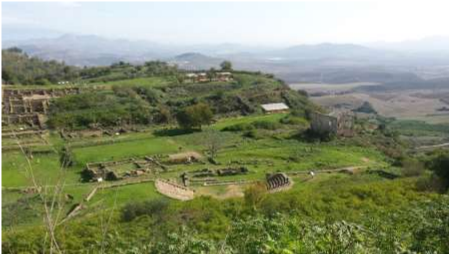
De archeologische site van Morgantina met op de voorgrond het ekklesiasterion en links op de achtergrond het Griekse theater

Voorafgaand aan ons bezoek aan Selinunte bezochten we de 'Cave di Cusa', de steengroeve waar de zuilen en architraven van de tempels in Selinunte werden voorbereid, voordat ze konden worden vervoerd naar de bouwplaats van de tempel.