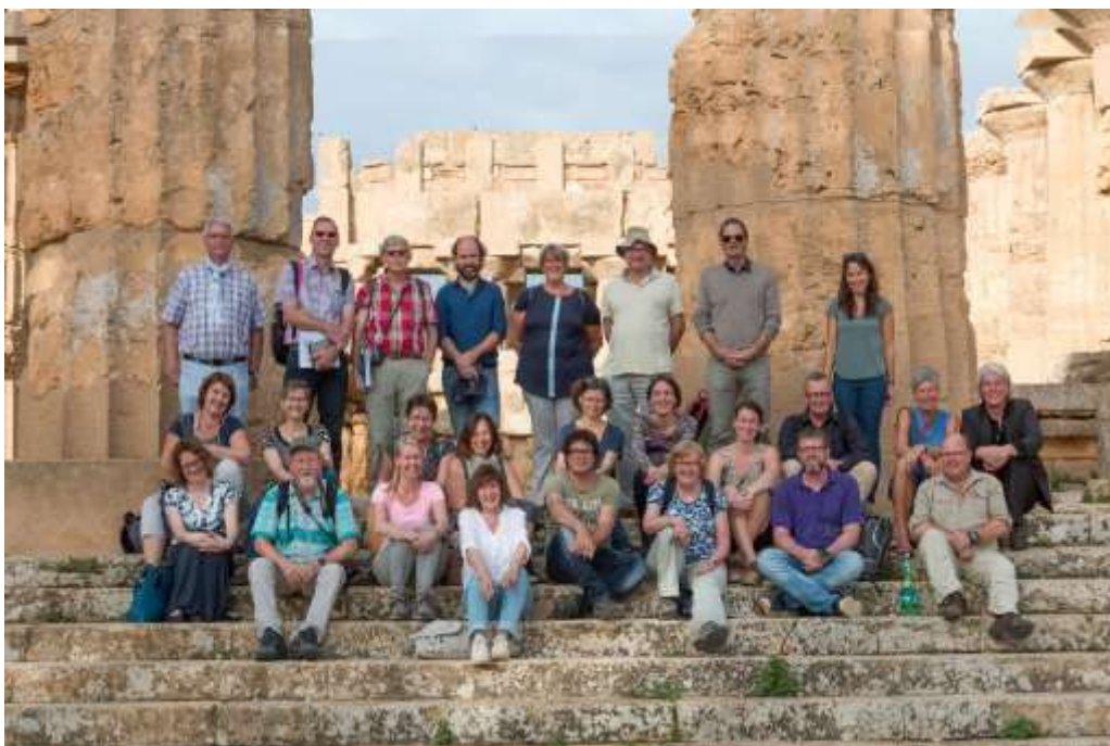
De groep bij de tempel van Hera in Selinunte

Daarbij maakten het prachtige zonovergoten Siciliaanse landschap en de schitterende blauwe zee deze week voor ons tot een onvergetelijke ervaring.